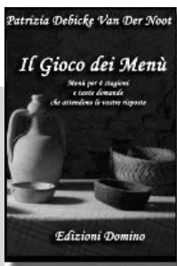
IL GIOCO DEI MENÙ