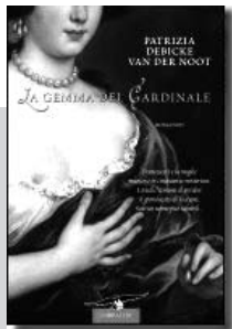
LA GEMMA DEL CARDINALE